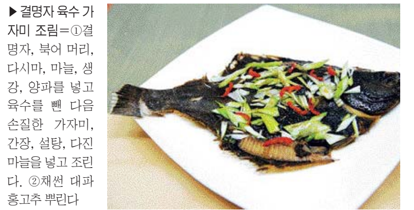
▶결명자 육수 가 자미 조림=①결 명자, 북어 머리, 다시마, 마늘, 생 강, 양파를 넣고 육수를 푼 다음 손질한 가자미, 간장, 설탕, 다진 마늘을 넣고 조리 한다. ②채썬 대파 흥고추 뿌린다