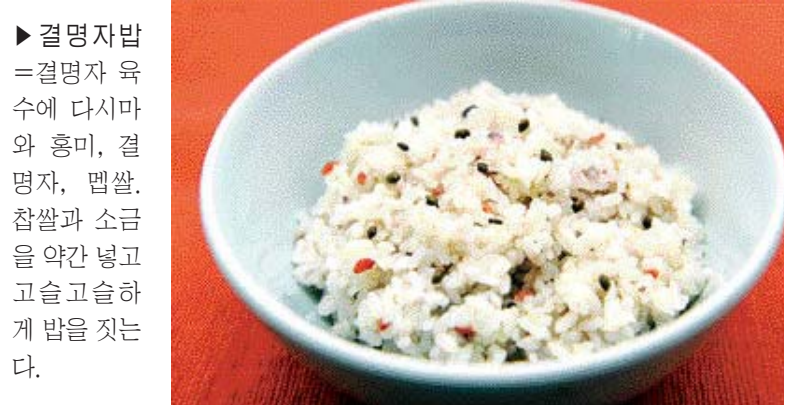
▶결명자 밥 =결명자 육 수에 다시마 와 홍미, 결 명자, 팥쌀, 참쌀과 소금 을 약간 넣고 고슬고슬하 게 밥을 짓는 다. <다음말=김지현 요리학원 정하나 연구원·푸드스타일리스트 정강영>