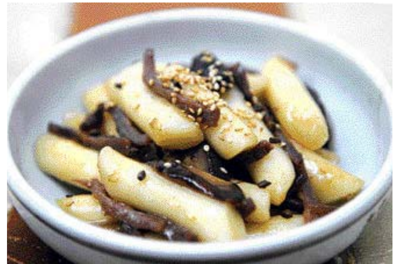
▶결명자 쇠고기 떡 볶음=①쇠고기, 표고버섯은 채썰어 불고기 양념을 하고 떡은 살짝 데친다. ②팬에 식용유를 두르고 쇠고기, 표고버섯, 떡 순으로 볶는다.