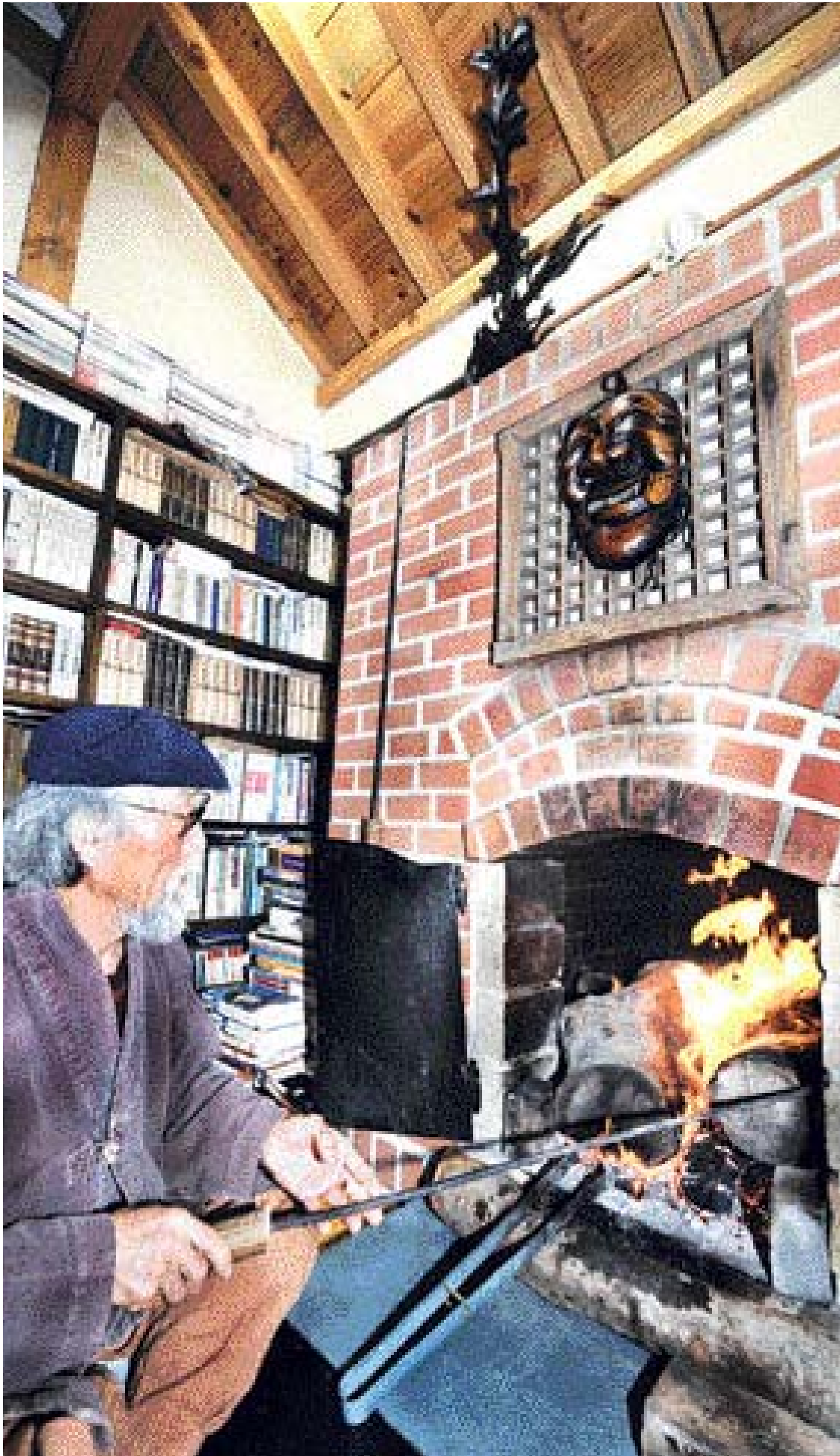
거실에 설치된 벽난로는 안전을 고려해 제철소 고로용 내화벽돌로 만들었다.