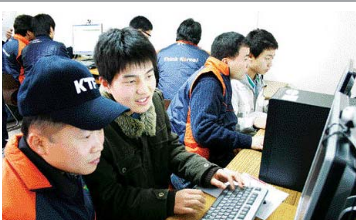
KTF 광주본부 직원들은 지난 22일 광주시 서구 쌍촌동 홀더 청소년 공부방을 찾아 '비기 IT 공부방' 자원봉사활동을 펼쳤다.

이에 따라 MS회원들은 USB 등의 휴대용 저장장치를 챙기거나 혹은 유료로 제공되는 웹스토리지 서비스에 돈을 낼 필요가 없게 됐다. 이 서비스를 이용하려면 MS사 윈도우 라이브(www.live.com)에 접속해 회원가입을 한 후 로그인을 통해 스카이 드라이브에 접속하면 된다.