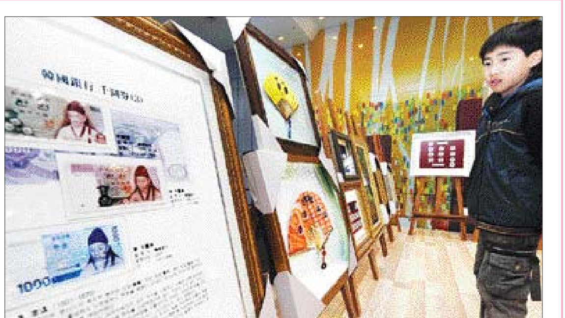
세계 희귀 화폐 전시장을 찾은 어린이 관람객이 신기한 듯 화폐들을 감상하고 있다.