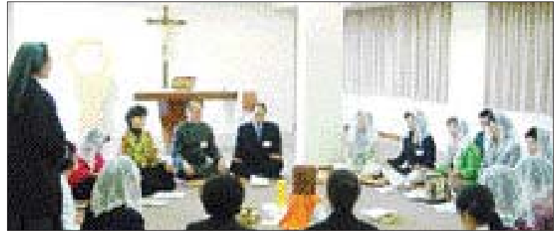
지난해 광주평화방송 후원회원들이 광주가톨릭대학교 평생교육원에서 열린 피정에 참여, 묵상을 하고 있다.