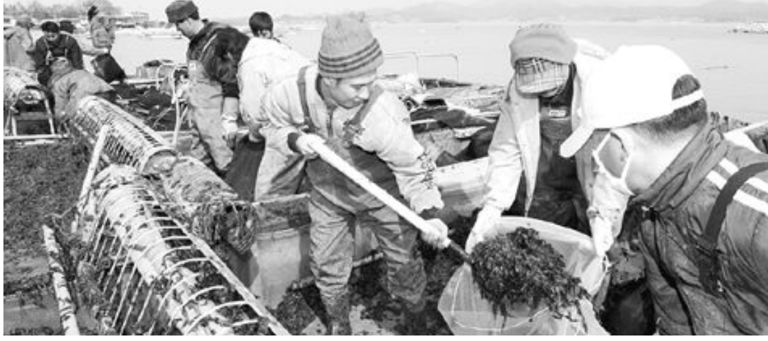
2월 무안군 해제면 삼봉 앞바다에서 김 양식업을 하는 어민들이 타르가 묻은 김을 채취하고 있다. 어민들은 하루 평균 1만2천500kg씩의 타르 묻은 김을 거둬 내고 있다.

지난해 12월 말 전남 서해안에 타르 덩어리가 유입된 지 두 달이 지났으나 어민들의 피해는 여전히 현재 진행형인 것으로 드러났다.