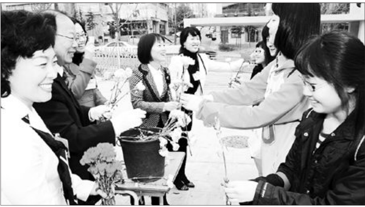
3일 개교한 광주시 서구 쌍촌동 상일여고 교직원들이 처음 등교하는 학생들에게 카네이션을 한송이씩 나눠주고 있다.