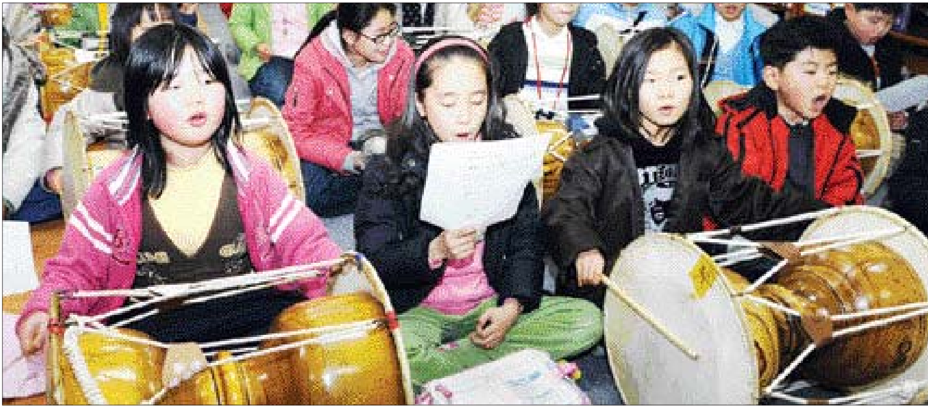
문화 나눔의 확산을 위해서는 지자체와 공공기관들의 참여가 많이되어야 한다. 북구청이 진행중인 '지역예술인과 함께하는 문화 공부방' 모습.