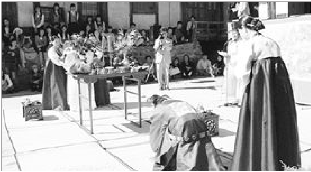
전통 혼례식에서 신부가 신랑보다 절을 많이 하는 것은 남녀 차별이 아닌 음·양의 이치를 따르는 우리 민족의 예절 때문이다.