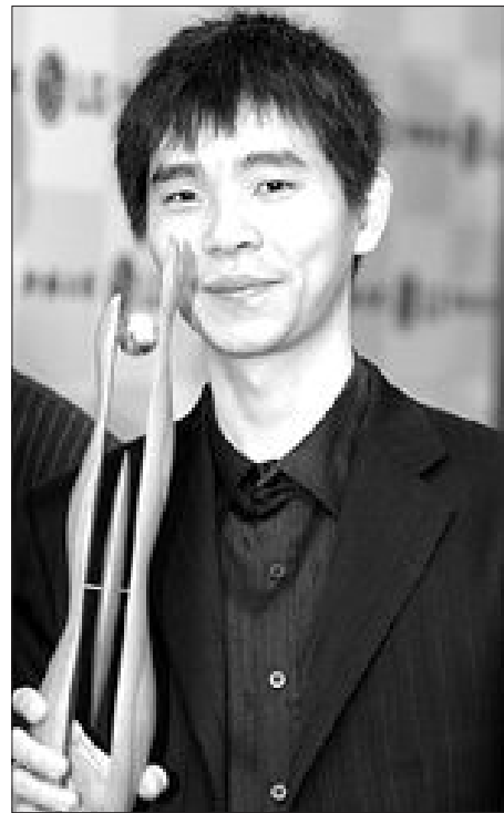
제12회 LG배 세계기왕전에서 우승을 차지한 이세돌 9단.

원성진 9단은 “이세돌을 무작정 싸움만 하는 기사로 평가하지만 놀랄 만큼 냉정하고, 수 읽기도 뛰어나다”고 평가했다. 이세돌도 LG배 세계기왕전 우승 직후 가진 인터뷰에서 “올해는 세계대회가 많이 열리는 해이다. 따라서 두 개 정도 더 우승하고 싶다. 하나를 꼭이라고 하면 4년에 한 번 열리는 응씨배 타이틀을 따내고 싶다”며 한국 바둑사를