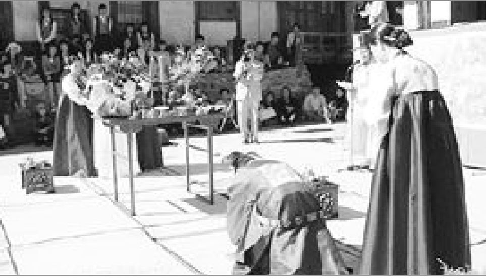
전통 혼례식에서 신부가 신랑보다 절을 많이 하는 것은 남녀 차별이 아닌 음·양의 이치를 따르는 우리 민족의 예절 때문이다.