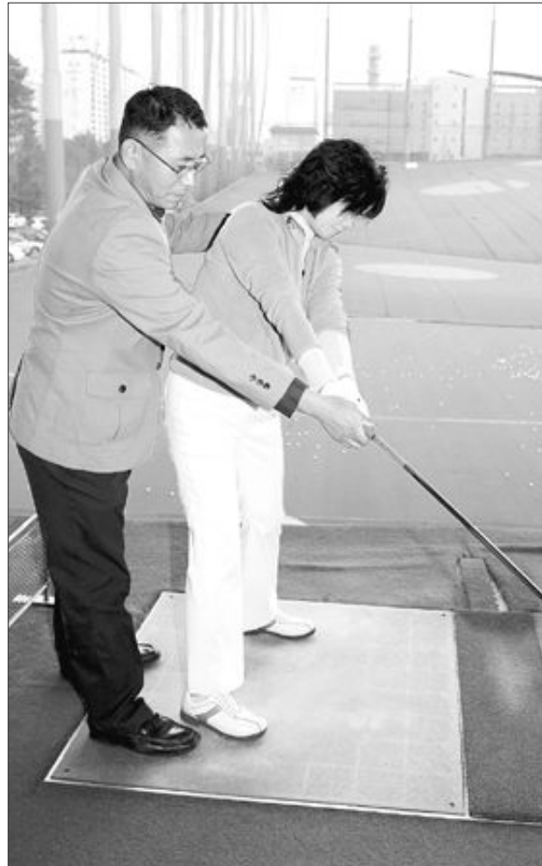
테이크백에서 오른쪽 팔로 급격하게 클럽을 들어올려 몸과 클럽 간격이 많이 벌어진 잘못된 자세(왼쪽)와 왼쪽 어깨의 충분한 회전을 이용한 올바른 테이크백 자세.