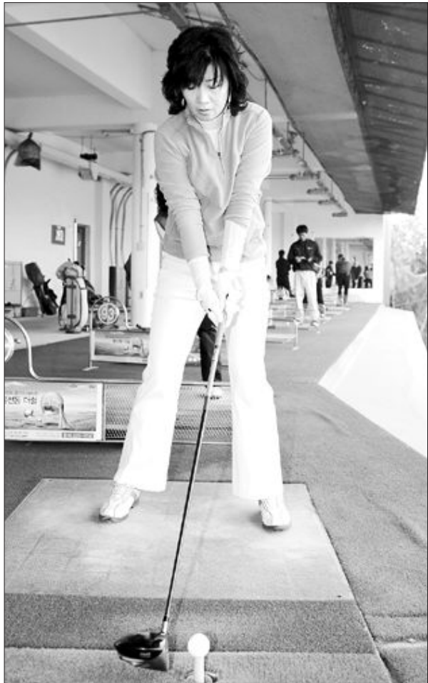
드라이버 어드레스에서 공이 중앙에 위치한 잘못된 자세(왼쪽)와 왼발에 공이 위치한 멋진 자세.

작은만남 큰 기쁨 광주일보 친절함 서비스와 고객의 입장에서 모시겠습니다.