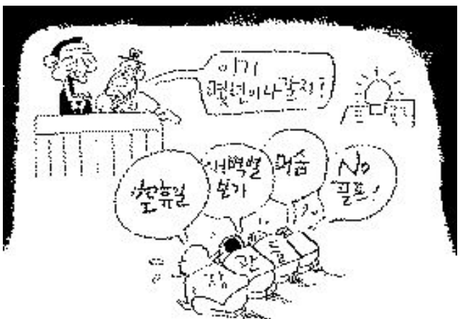
총선응만 아니어도 좋겠다