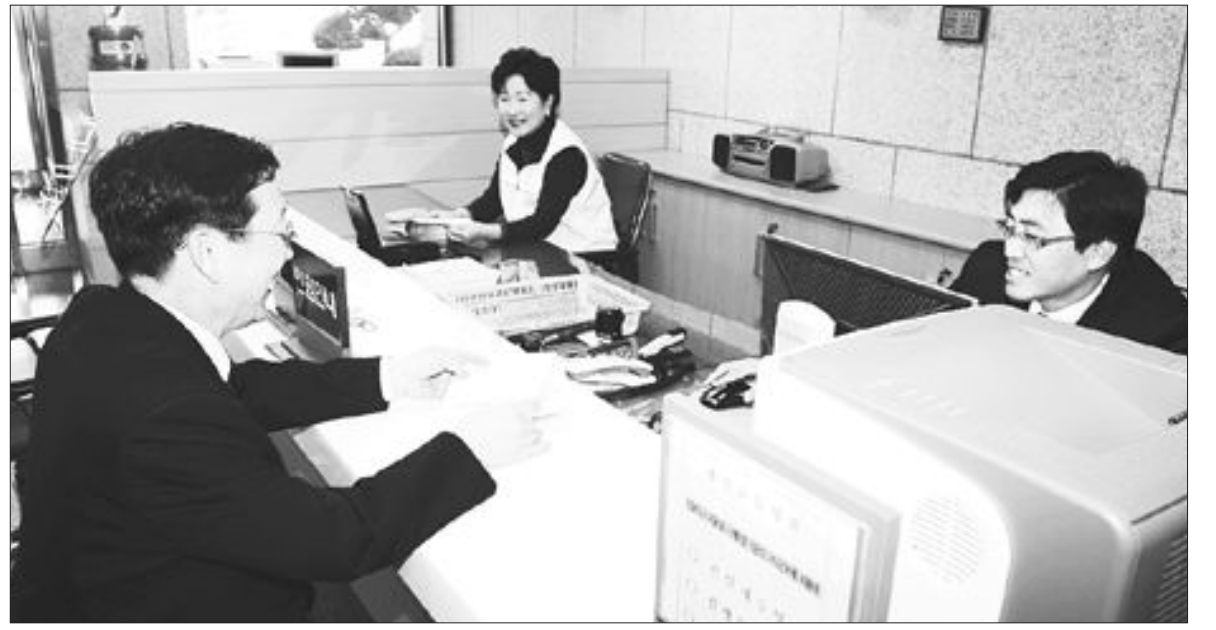
광주고법, 원스톱 민원 서비스 광주고등법원이 원스톱 민원실 운영을 시작한 10일 오전 청사 1층 로비에서 민원실 직원들이 민·형사사건의 증명서를 발급하고 있다. 원스톱 민원실에서는 민원서류의 대필, 민원업무 대행, 무료법률 서비스 등이 제공된다.