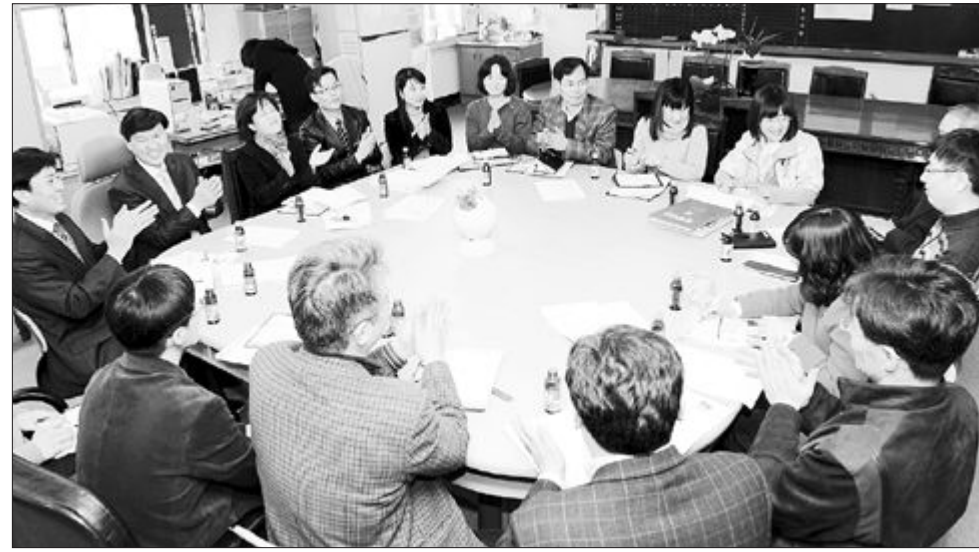
이소연씨의 모교인 광주과학고 교사들이 10일 이소연씨 우주비행에 축하할 TF팀 구성을 위해 긴급 회의를 갖고 있다.