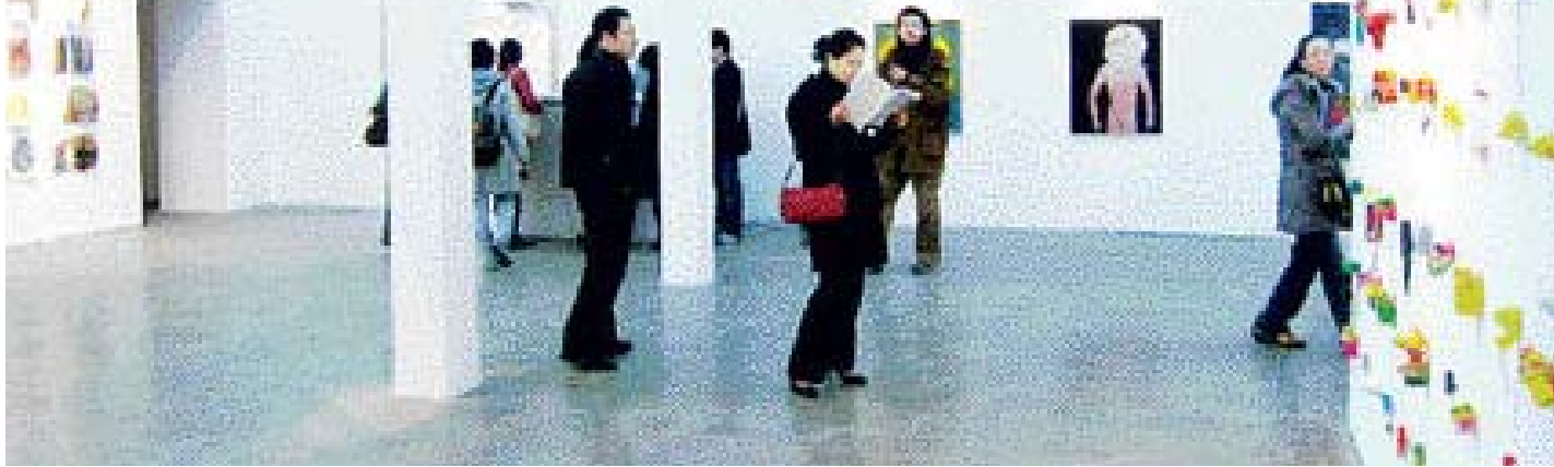
최근 지역 작가들이 세계 3대 미술 시장으로 떠오른 중국에 잇따라 진출하고 있다. 아라리오 베이징 갤러리에서 열리고 있는 '신세계미술제 수상작가전'