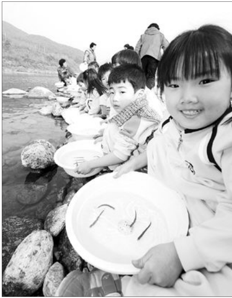
“연어야 꼭 돌아 오렴” 11일 구례군 간전면 섬진강변에서 열린 제 11회 어린이 연어 방류행사에서 유치원생들이 연어를 섬진강에 방류하고 있다.

이세돌 9단은 국내의 8관왕 타이틀 보유와 ‘2006-2007년 2년 연속 ‘한국바둑대상’을 수상했다. /신안=조원남기자 wncho@