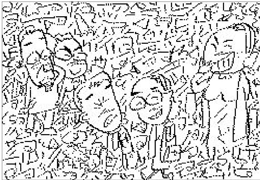
찾아(보)세(요) 서툰족, 사자, 펜촉, A자, 음표, 갈매기, 불링핀, 당근, 다리미