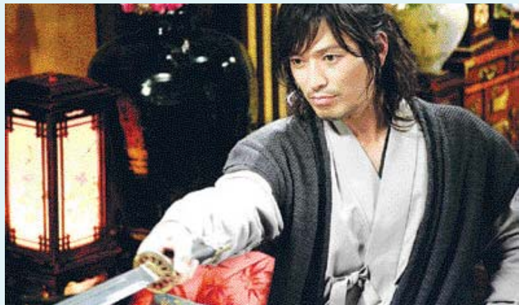
100억원의 제작비가 투입된 블록버스터 영화 '신기전'

의 기생 설지가 주인공이다. '태풍' 이후 오랜만에 영화에 모습을 보인 이정재가 천동으로 출연하며 만득 역은 김석훈이 맡았다. 최근 박찬욱 감독의 신작 '박쥐'에 캐스팅돼 화제가 됐던 김옥빈이 설지역으로 출연한다. 영화팬들의 기대치를 한층 높여 주고 있는 작품은 '쌍화점'이다. '결혼은 미친 짓이다', '말죽거리 잔혹사', '비열한 거리'를 통해 많은 팬을 확보하고 있는 유하 감독과 스타 조인성이 함께 호흡을 맞췄기 때문이다. 여기에 '미녀는 괴로워', '사랑' 등을 통해 총무로의 블루칩으로 떠오른 주진모와 송지효가 가세했다. 고려시대 말을 배경으로 왕과 꽃미남 호위무사, 왕비의 미모 한 삼각 관계를 그리게 될 '쌍화점'은 왕과 호위무사의 동성에 코드 등이 눈길을 끈다.