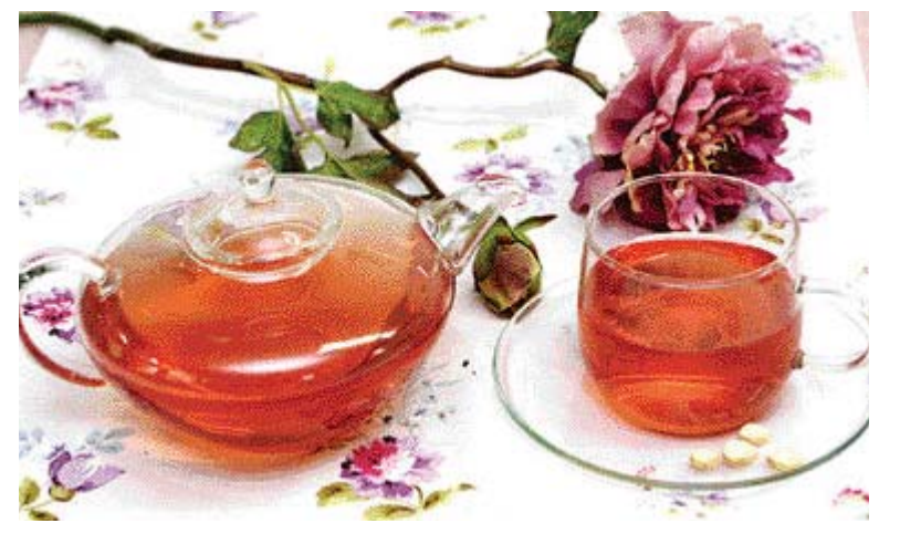
▲인삼 오미자차=①끓인 물을 식혀 오미자에 붓고 물이 우러나도록 24시간 둔다. ②고운 체에 ①을 걸러 8배 가량의 물과 인삼 달인 물을 붓고 냉장고에 보관해 마신다.