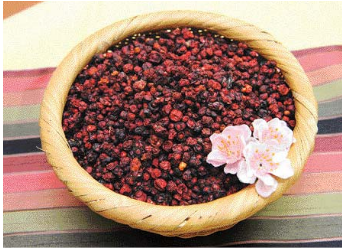
오미자는 피로를 풀어주고 머리를 맑게 해 수험생에게 좋은 식품이다.

차로 끓여 잔뜩해도 좋다. 오미자 30~40g을 3~4시간 찬 물에 담근 뒤 1ℓ의 물에 넣고 20~30분 동안 약한 불로 끓이면 된다. 한꺼번에 많은 양을 끓여서 냉장 보관한 뒤 살짝 데우