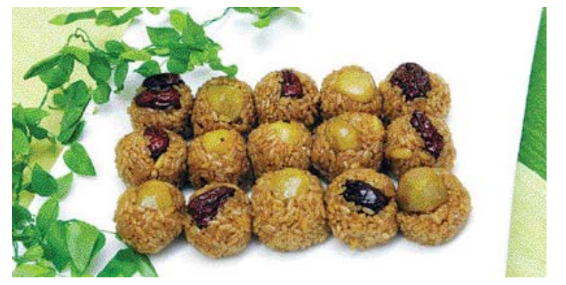
▲오미자 약식=①불린 찰밥을 오미자 우린 물을 뿌리면서 찐다. ②냄비에 설탕과 오미자 우린 물을 넣고 캐러멜 시럽을 만든다. ③찐 찰밥에 캐러멜 시럽, 흑설탕, 간장, 계피가루, 참기름을 넣고 버무려 30분 정도 둔 뒤 밥, 대추, 잿을 넣고 면보를 깔 찜통에 20분 찐다.