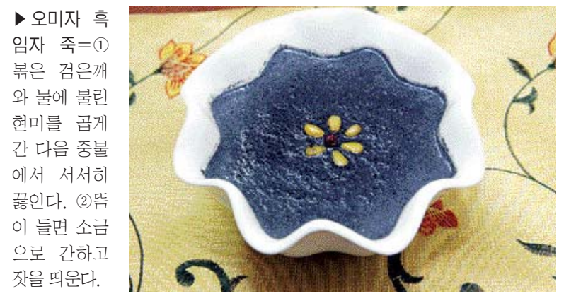
▶오미자 흑임자 죽=①볶은 검은깨와 물에 불린 현미를 곱게 간 다음 증발에서 서서히 끓인다. ②뜸이 들면 소금으로 간하고 잿을 띄운다.