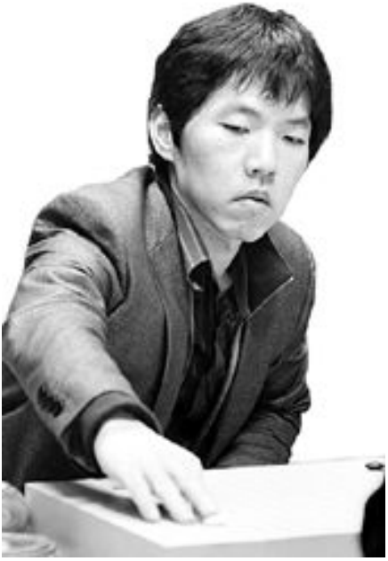
<광주 대표로 출전하는 이창호 9단>