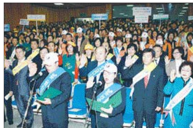
‘광주시 북구 U대회 범시민지원추진협의회’는 최근 북구 청소년수련관에서 각계 인사, 주민 등이 참석한 가운데 U대회 광주 유치 기원 북구민 결의대회를 가졌다.