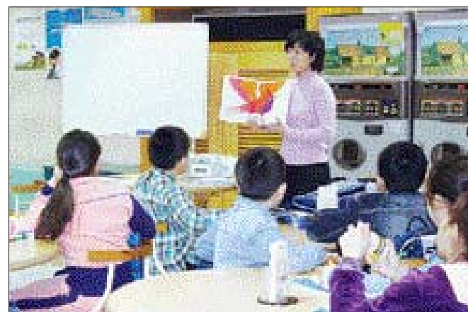
한국마사회 광주지점은 최근 광주시 동구 계림동 마사회 3층 문화센터에서 저소득층 어린이를 위한 무료 영어교실을 열었다. 영어교실은 매주 화·목요일 오후 4시에 운영된다.