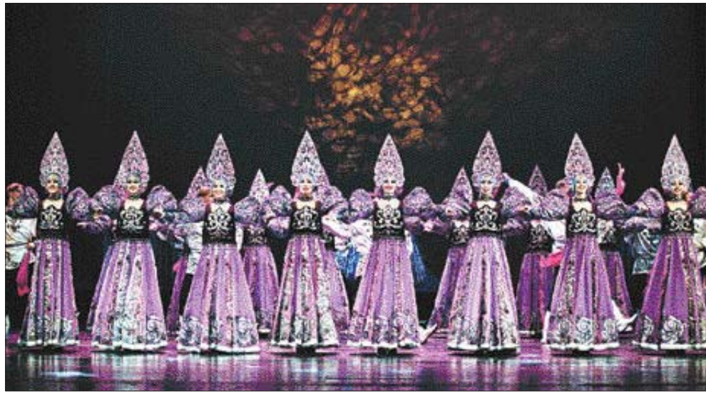
광주국제공연예술제가 올해 행사의 기본계획조차 마련하지 못하는 등 난맥상을 보이고 있다. 지난해 광주국제공연예술제에 참가한 모스크바무용단의 공연 모습.

적절하지 못한 예산 집행도 문제다. 지난해 예산은 약 11억 4천만원이었지만 티켓 판매 부진