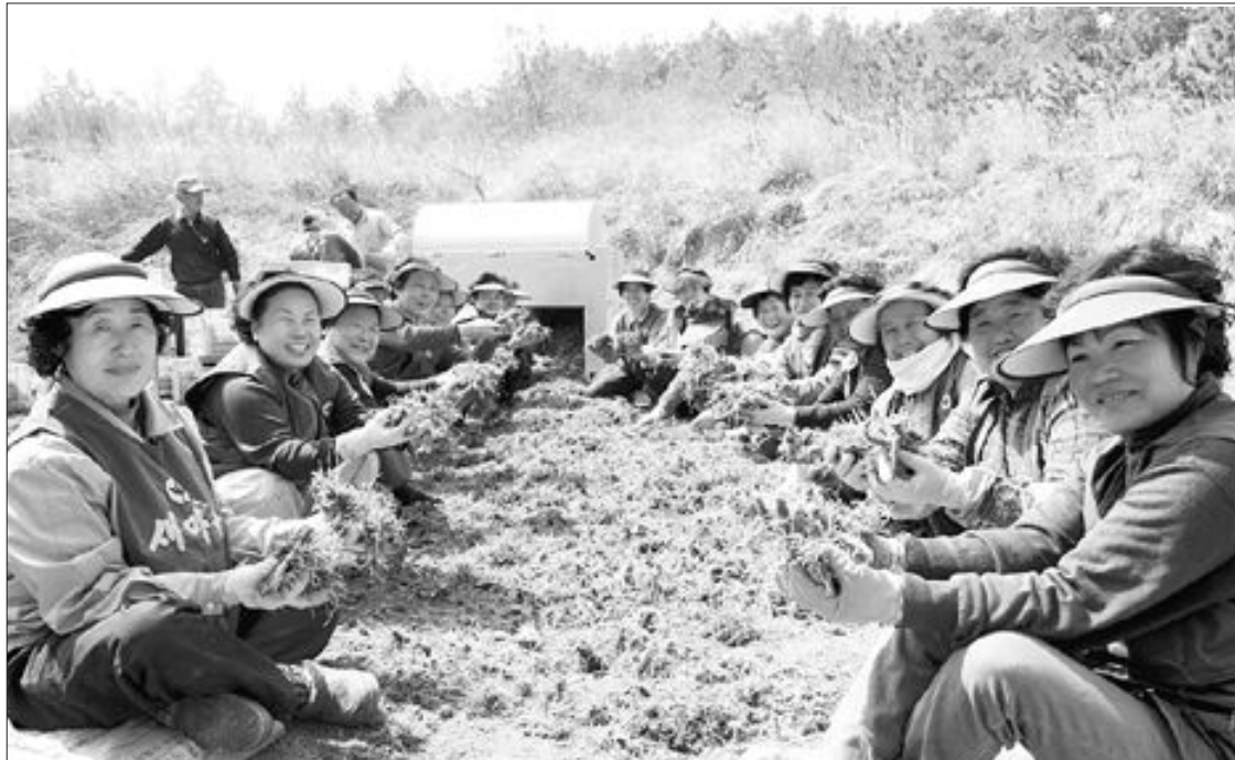
‘세계 물의 날’(22일)을 맞아 환경부장관상을 받은 새마을운동 함평군지회 회원들이 20일 함평을 농업기술센터 인근 밭에서 친환경 수생식물인 야생 창포를 가꾸고 있다.