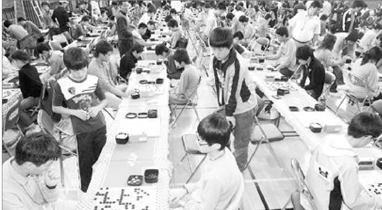
최근 광주바둑협회가 광주시체육회 정가맹단체 등록을 추진하고 있다. 사진은 지난해 광주에서 열린 제88회 전국체육대회 바둑동호인 대회 모습.

한국바둑은 오랜 논란 끝에 지난해 대한체육회에 준가맹단체로 등록했고, 광주우 아시안게임을 바둑을 정식 종목으로 채택되면서 외형적으로 바둑의 스포츠 시대가 시작했다. 일본