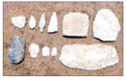
문헌자료인 '동계문서'도 지방문화재로 함께 지정 예고됐으며 예고기간을 거쳐 다른 문화재들과 함께 공식 지정문화재로 지정된다.

장흥군은 25일 "신북 구석기 유적과 호계리 별신제, 동계문서 등이 지방문화재로 지정예고됐다"고 밝혔다. 기념물 238호인 신북 구석기 유적은 국도 2호선 장흥~장동간 도로 확·포장 공사 중 발견돼 약 3만여점의 구석기 시대 석기류와 토기(사진) 등이 발굴됐다. 2만2천여년전으로 추정되는 신북 구석기 유적은 국내에 보고된 구석기 유적 가운데 가장 크고 유물의 밀집도도 높아 동북아시아 후기 구석기문화와의 연관성을 풀 수 있는 학술적 자료로 평가받고 있다. 신북 유적과 함께 지정 예고된 장흥군 부산면 호계리 별신제는 1702년에 시작해 현재까지 전승 보존되고 있으며