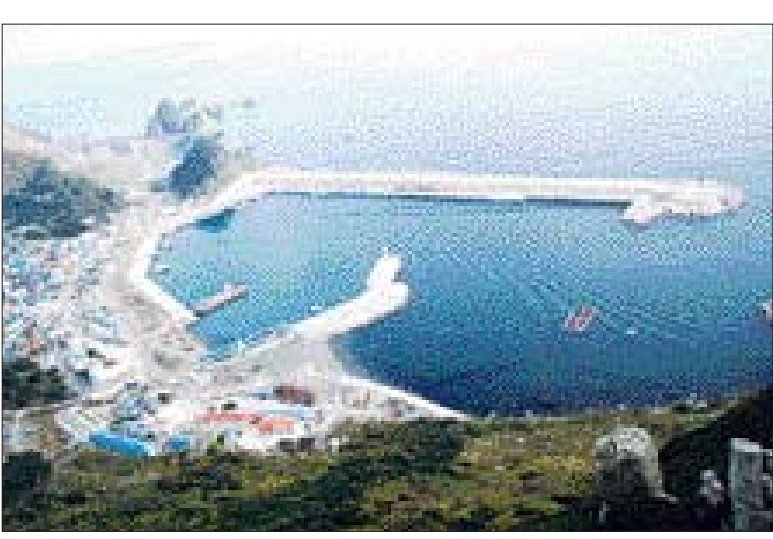
세차레나 공사가 중단되는 우여곡절 끝에 착공 29년만에 준공을 눈앞에 둔 가거도 국가어항 전경.

태풍에 파손·유실·복구 '우여곡절' 국내 최초 108t 큐브블록 공법 시공