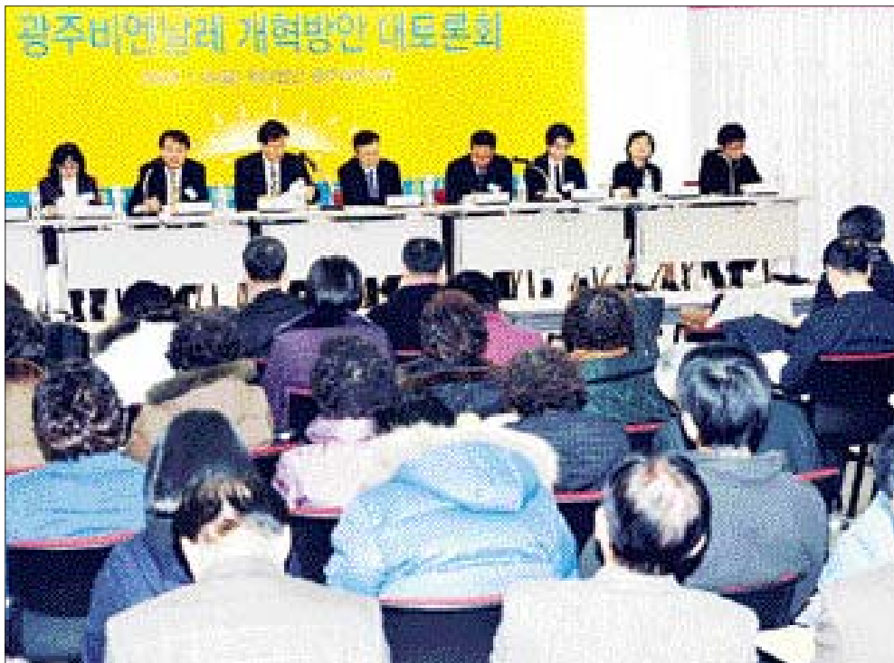
광주비엔날레 개혁작업이 광주시와 재단의 소극적인 자세로 속도를 내지 못하고 있다. 지난 1월 열린 비엔날레 개혁방안 대토론회 모습.

현재 재단 안팎에선 2~3명의 문화계 인사 후보로 물망이 오르고 있지만 재단이 내건 문화