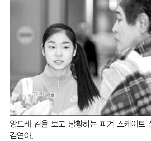
앙드레 김을 보고 당황하는 피겨 스케이트 선수 김연아.

황하는 모습이 정말 재미있네요.”, “얼마를 찾는 걸 보니 김연아도 아이가 맞긴 맞네요. 너무 귀여워요.”라는 반응을 보였다.