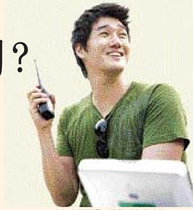
3편의 단편영화를 감독한 배우 유지태.