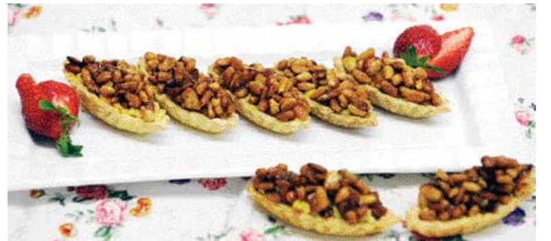
▲ 잣 타르트=①버터, 설탕, 달걀, 밀가루, 다진 잣을 넣고 섞은 뒤 얇게 밀어 모양틀로 찍어 오븐에 구워낸다. ②구운 타르트 속에 커스터드 크림을 담고, 캐러멜 소스를 입힌 잣을 올려 다시 오븐에 5분 정도 구워낸다.