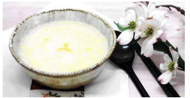
▲ 잣 죽=①볼린 쌀과 잣을 간다. 쌀을 먼저 냄비에 끓인다. ②뜨거운 잣 죽을 넣고 잠시 끓인 다음 통잣을 넣어 소금으로 간한다.