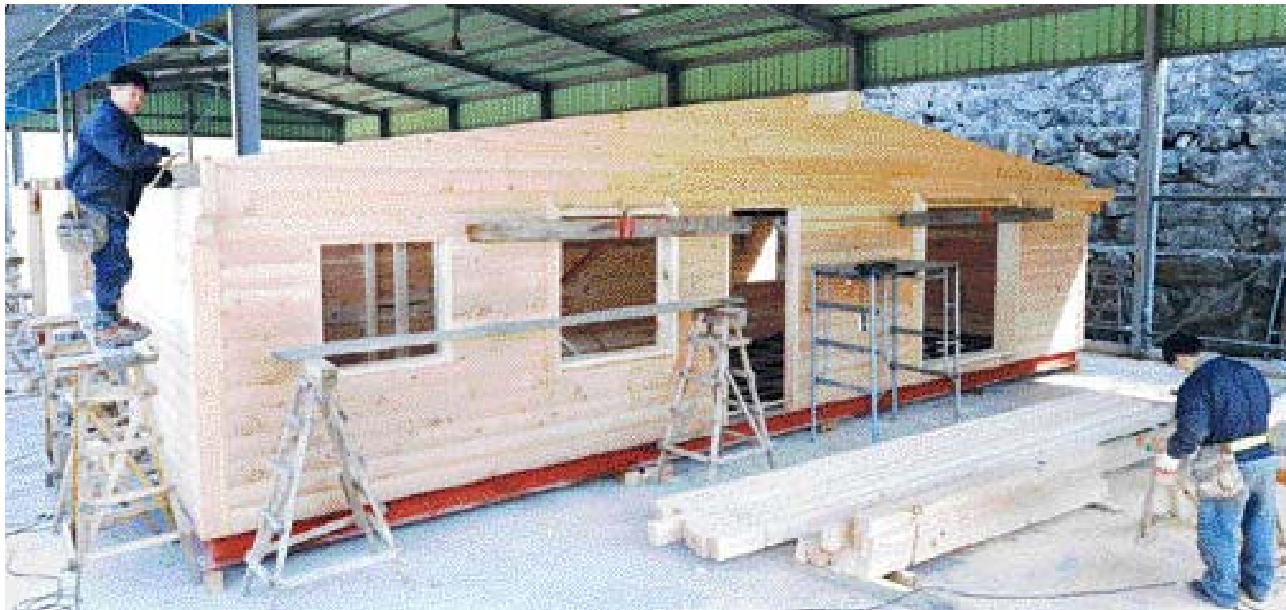
한국목재산업(주) 직원들이 이동식 통나무집을 짓고 있다. 일반인들이 통나무집을 직접 지으려면 건축 교육기관 등을 통해 기술을 먼저 익히는 것이 중요하다.