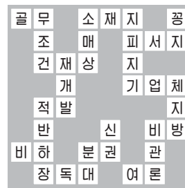
<함께 풀어봅시다 294회 정답>