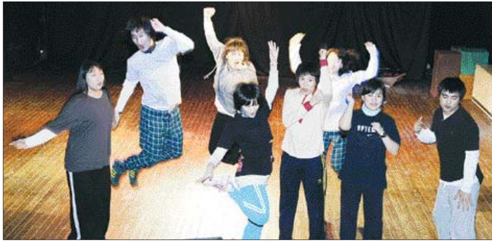
9일부터 13일까지 열리는 광주연극제는 모두 5개 극단이 참여, 경연을 펼친다. 극단 유피씨어터의 '위대한 유산' 중 한장면.