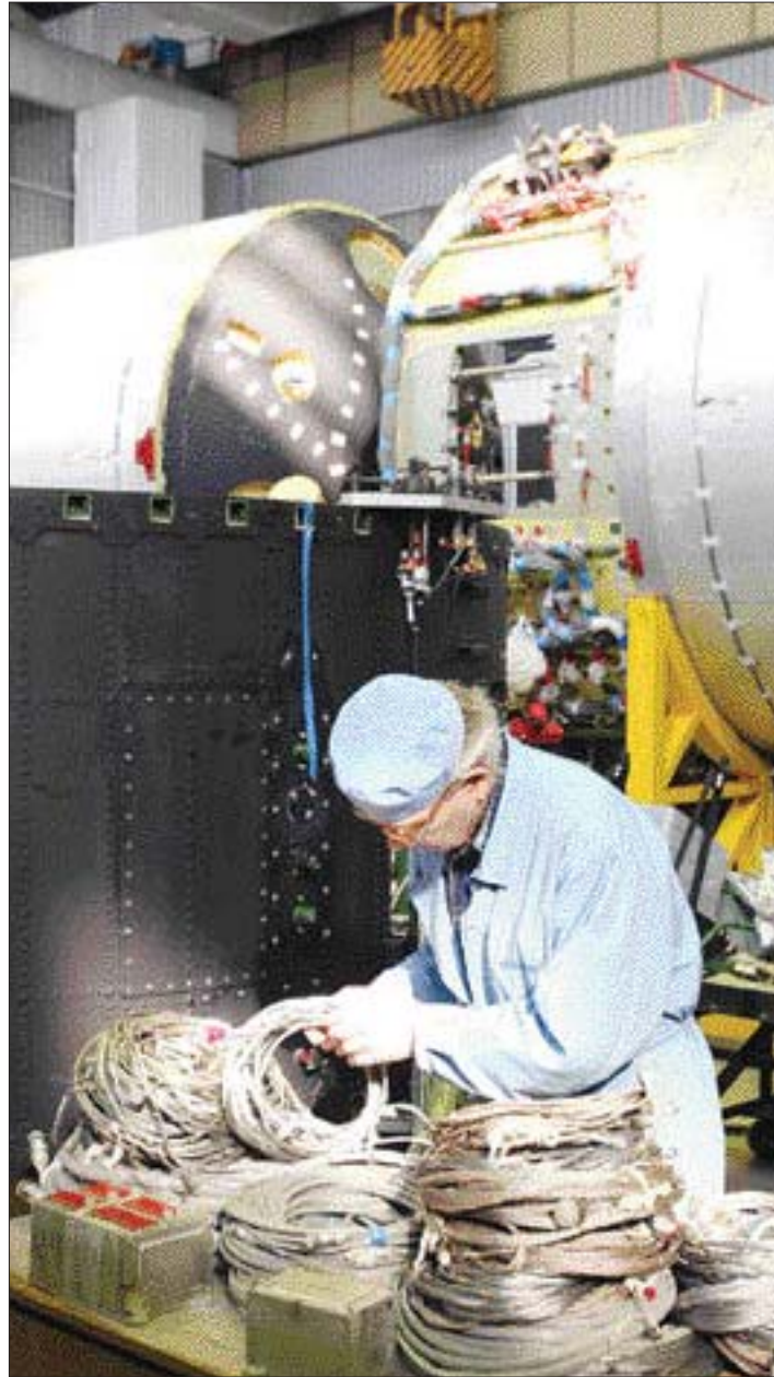
오는 12월 고흥 나로우주센터에서 발사될 KSLV-1용 지상시험장비(GTB)가 모스크바 흐루니체프사에서 제작되고 있다.

엔진(GTB) 조립이 한창 진행 중인 KSLV-1에 쏘았다. GTB는 로켓 엔진과 연료공급 라인 등을 모두 결합해 지상에서 연소시험을 하는 것으로 로켓의 핵심장비다. 러시아는 GTB를 한국에 인도하기 전 오는 7~8월께 GTB 연소시험을 할 예정이다. 한국에서는 연소시험을 하지 않고 대신 성능 시험만 진행한다. 여기서 아무런 이상이 없으면 비행용 엔진이 10월 한국으로 건너오고 약 3개월간 테스트를 받게 된다. KSLV-1 발사 후에도 GTB는 남겨 되는데 한국은 이것을 철저히 분석해 2호 개발에 이용할 계획이다.