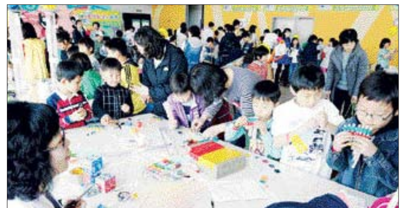
지난 12일 오후 광주시 북구 오룡동 디자인센터에서 열린 '제1회 어린이 과학체험전'에 참가한 어린이들이 과학실험을 하며 즐거워하고 있다.

순 전남대 약대 교수)가 광주지역 초등학생 230여명을 대상으로 '제1회 어린이 과학체험전'을 마련했다. 이날 체험전에는 지원센터를 거쳐 취업한 방과후 학교 과학탐구교사 등 10여명의 여성과학인들이 초등학생들의 과학적 상상력과 호기심을 키우기 위해 부스 11개를 자발적으로 설치, 운영했다.