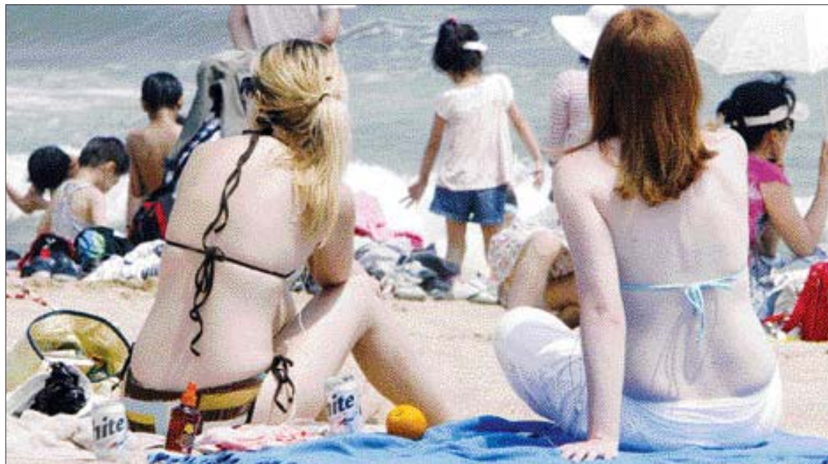
여름철 해변이나 수영장에서 과감한 비키니 수영복을 입고 몸매를 뽐내고 싶다면 지금부터 관리를 시작해야한다. 지난해 부산 해운대해수욕장 백사장에서 시민들이 더위를 식히는 모습.

◇몸매는 관찮은데 겨드랑이 '털' 때문에=여름 해변에서 비키니 몸매를 뽐내다가도 금방 자라난 체모 때문에 스트레스를 받는 여성들이 많다. 혼자서 면도를 하고, 족집게와 제모크림 등을 사용하는 것도 한계가 있다. 또 제모 후 생기는 피부 트러블도 여간 골칫거리가 아닐 수 없다. 이런 분들께는 반영구적인 레이저 제모술을 추천한다. 레이저 제모는 보통 5~6회 정도 시술하게 되는데 시기상 여