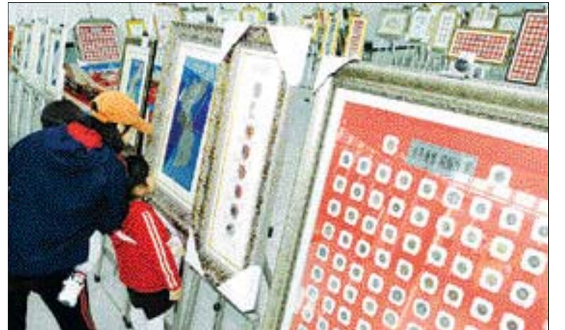
22일 세계 희귀 화폐 전시장을 찾은 모녀 관람객이 다정하게 각국의 화폐를 감상하고 있다.