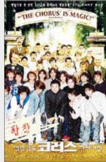
르스'가 장식한다. 2차 대전 직후 시골의 작은 기숙사 학교에 부임한 선생님이 음악을 가르치며 노래를 통해 희망을 이야기하는 영화로 아이들이 실제 부르는 합창

27일 오후 4시 열리는 '명랑극장' 첫번째 프로그램은 프랑스에서 900만명을 동원한 가족영화 '코