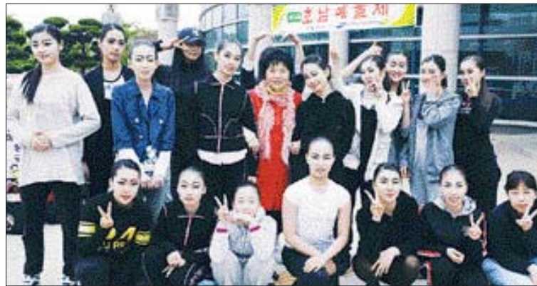
지난 26일 광주일보 주최 '제53회 호남예술제' 현대무용 군무 부문에서 최고상을 수상한 대성여중 무용부가 포즈를 취했다.