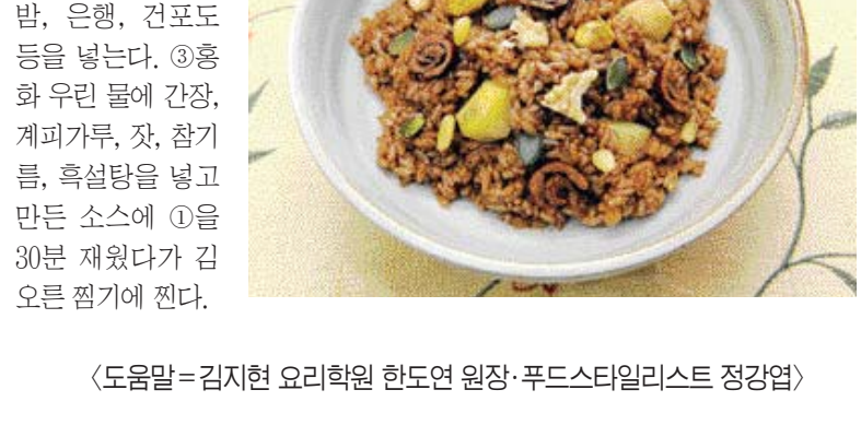
▶홍화 약밥=①홍화 우린 물에 불린 찹쌀을 넣고 찐다. ②대추, 밤, 은행, 견포 등을 넣는다. ③홍화 우린 물에 간장, 계피가루, 잣, 참기름, 흑설탕을 넣고 만든 소스에 ①을 30분 재웠다가 김으로 찜기다 찐다.