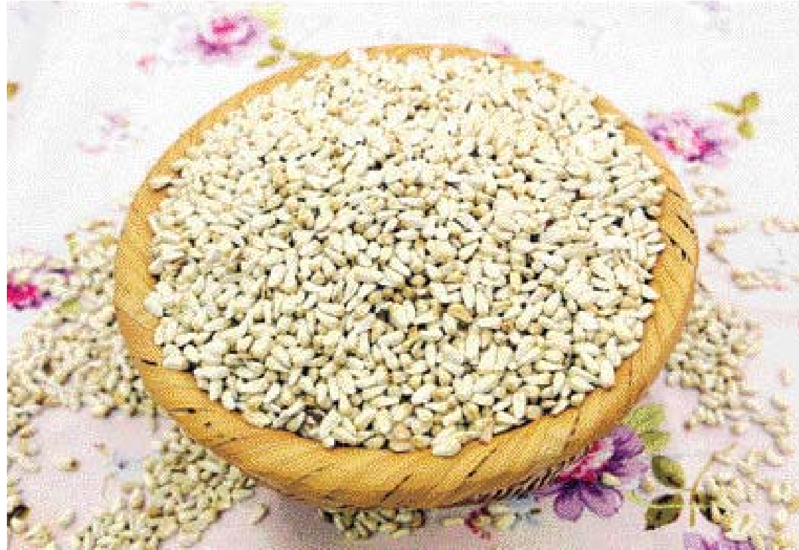
홍화씨에는 각종 여성질환과 골절 치료를 돕는데 탁월한 성분이 많이 함유돼 있다.

는 탁월한 약효가 확인되면서 약용으로 쓴다. 홍화는 특이한 냄새가 있고 맛은 조금 쓰다. 홍화 기름에 함유된 풍부한 리놀산(linolic acid)은 콜레스테롤을 정화시킨다. 홍화 껍질에는 유기백금, 칼슘, 마그네슘, 칼륨 등 각종 영양소가 고루 들어있다. 뼈가 부러지거나 금이 갔을 때 홍화를 먹는 것은 바로 유기백금 성분 때문이다. 유기백금은 골절 부위에서 전기의 교류작용을 활발하게 해 백혈구를 모이게 하다는 연구 결과가 나왔다. 또 칼슘, 구리와 함께 뼈를 빨리 접착, 결속시켜 부서진 뼈를 이어주고 무쇠처럼 튼튼하게 해주는 효능이 있다. 암세포와 결합하면 서로 화학작용을 일으켜 암세포를 파괴시키는 것으로 알려졌다.