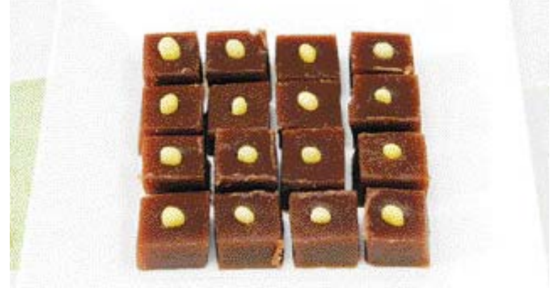
▶홍화 양갱=①찬물에 불린 앙금과 홍화 우린 물을 같이 끓이다 설탕, 팔랑김, 물엿을 넣고 조리다. ②물에 부어 굳힌 다음 썰어낸다.

으며 된다. 하루에 두 번 복용하고, 독성이 없어 장복을 해도 괜찮다. 국내에서는 충남 서산 등지에서 많이 재배된다. 일부 중국산은 중금속 함유 기준치를 초과해 주의해야 한다. 지난해 식품의약품안전청의 '생약 중 중금속 검사실적' 자료에 따르면 중국산 홍화에서 기준치의 20배에 달하는 카드뮴 6ppm이 검출됐다. 국산은 씨에 갈색 반점이 많고, 표면이 거칠다. 반면 중국산은 갈색 반점이 적고, 표면이 매끄럽다. /오광목기자 kroh@kwangju.co.kr