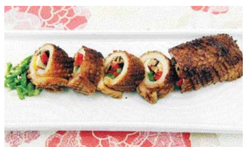
▶홍화 오징어 조림=①오징어는 겹질을 벗기고 안쪽에 대각선으로 칼집을 넣어 오이와 당근을 채 썰어 넣고 만든다. ②홍화씨 우린물, 간장, 물엿, 미림, 다진 파, 마늘, 후춧가루 양념을 끓인 다음 오징어를 넣고 조리한다.