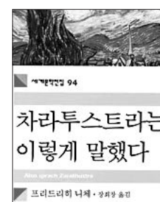
니체의 '차라투스트라는 이렇게 말했다'

목사의 아들로 태어난 니체는 '신은 죽었다'고 까지 선언한다. 그것도 인간들의 손에 의해 죽임을 당했다고 말한다. 이는 기독교인들의 신앙을 문제 삼은 것이다. 그들은 죽음의 설교자요, 신체의 경멸자라고 공박한다.