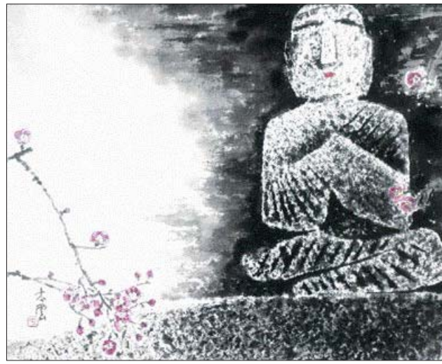
오건규 작 '석불과 흥매'

벳 불교 성인들의 사리 1천여 과를 선보인다. 문의 061-852-3038.