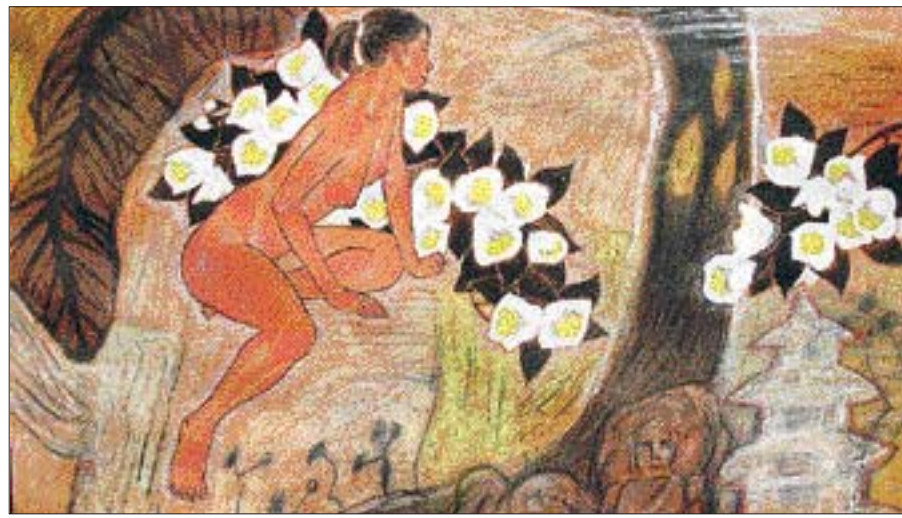
장현우 작 '남풍-운주인상'

이번 전시회에서는 부처님과 가섭, 사리불, 목련, 아난다 등 부처님 10대 제자, 그리고 나귀르주나(용수보살), 예세 초월 등 티