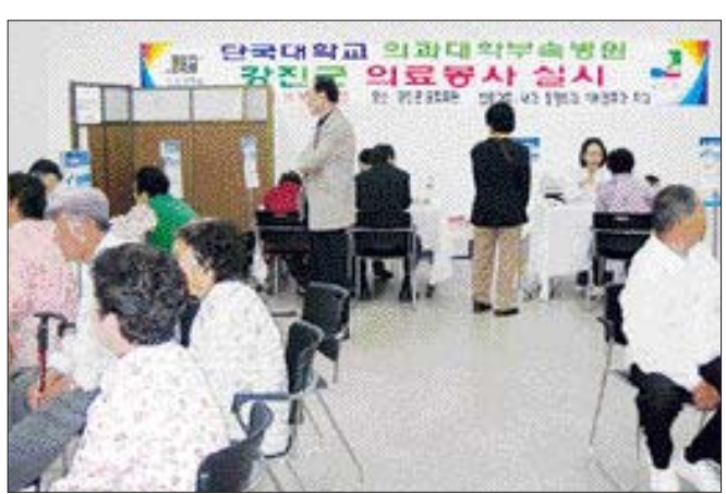
단국대병원 의료봉사반 21명은 최근 강진문화회관에서 300여명의 주민들을 대상으로 내과, 정형외과, 이비인후과, 치과 등 4개 진료 과목 무료 의료봉사 활동 펼쳤다.