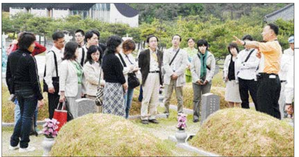
전국교직원노동조합 광주지부의 초청으로 광주에 온 일본 홋카이도 교사들이 12일 오후 국립 5·18민주묘지를 방문해 참배를 하고 있다.

"일본에서 말로만 들던 5·18민중항쟁을 현장에서 직접 보고 체험해보니 광주 시민들의 민주화 열망이 고스란히 전해져 옵니다."