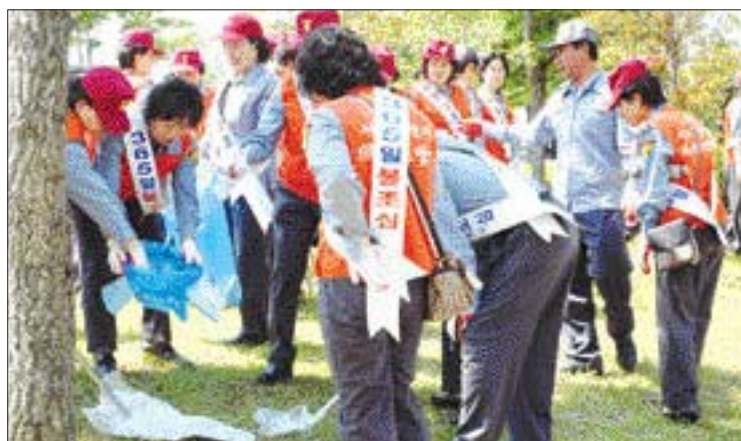
광주시 소방안전본부는 15일 서구 풍암동 월드컵경기장에서 광주지역의 용소방대원과 소방공무원 등 1천여명이 참여한 가운데 경기장 및 주변도로 환경정화 활동을 벌였다.