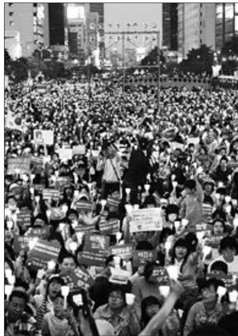
미국과의 수호통상조약을 맺은 지 126년, 전국에서 미 쇠고기 수입에 반대하는 촛불문화제가 열리고 있다.

조선은 "양 체결국은 각각 외교대표를 상호 교환하여 양국의 수도에 주재시킨다"는 제 2조의 합의 내용에도 불구하고 재정난과 청나라의 방해로 미국에 상주 공사관을 두지 못하다가 1887년 11월 박정양을 초대 공사관 파견했다. 하지만 박정양은 청의 합력으로 1888년 11월