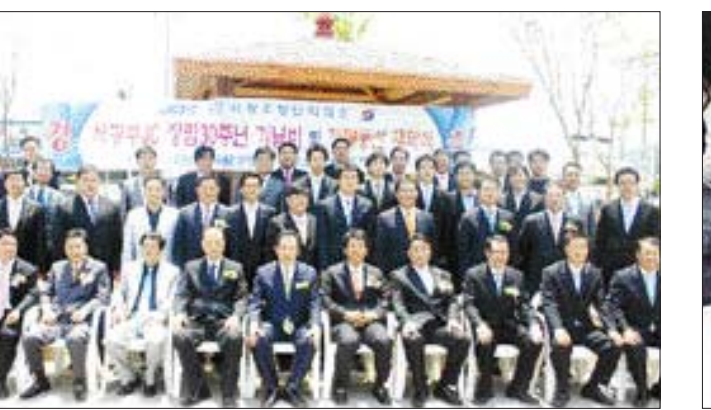
(사)서광주청년회의소(JC)는 지난 27일 서구 서창동 전평제 인근 도로에서 ‘행복동산’ 제막식을 가졌다. 서광주JC는 서구청으로부터 기증받은 전평제 인근 부지 529㎡에 행복 동산을 조성했다.