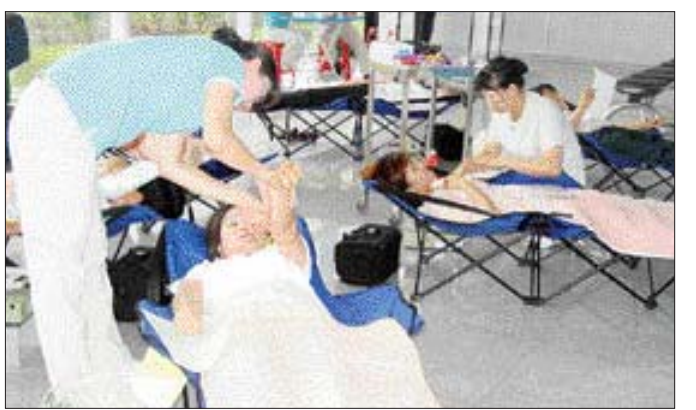
광주정부통합전산센터는 28일 1층 미팅룸에서 공무원 및 위탁운영사업자 100여명이 참여한 가운데 ‘사랑의 헌혈 행사’를 가졌다.