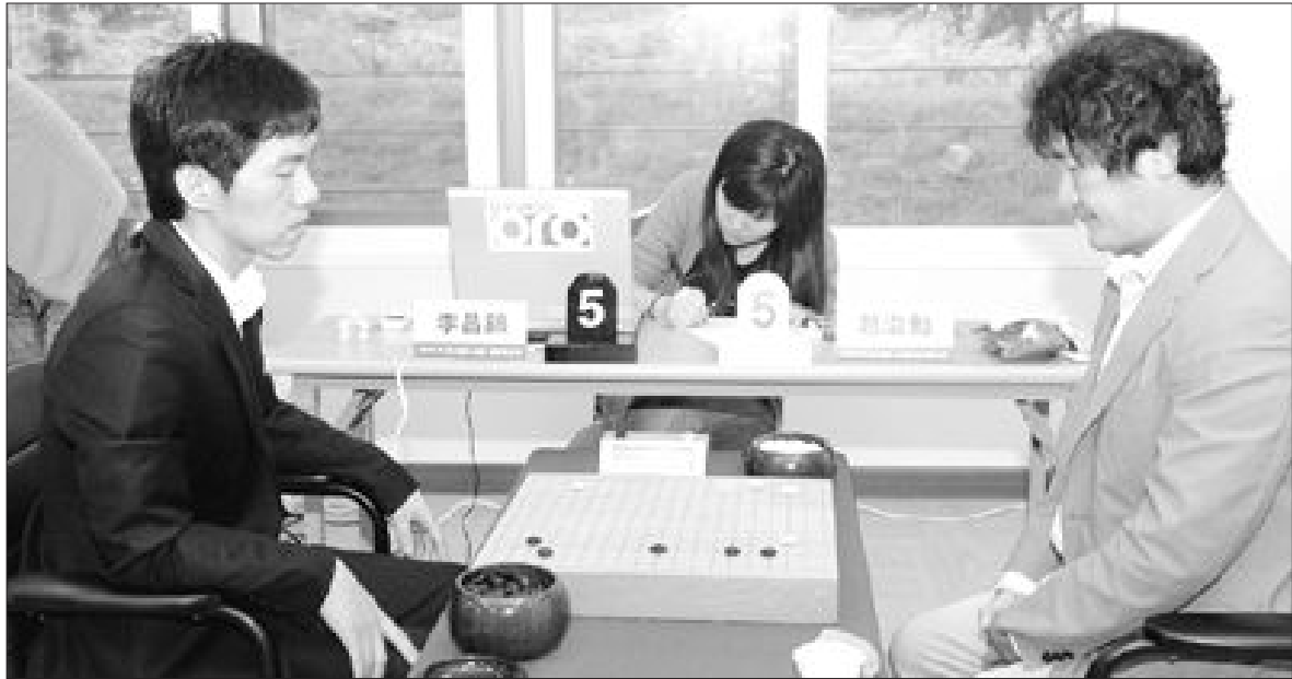
LG배 기왕전, 한국팀 4명 8강 진출 제13회 LG배 세계기왕전 8강전에 이창호, 이세돌, 박영훈 9단과 김형우 2단 등 한국 프로기사 4명이 진출했다. 사진은 지난 28일 열린 이 대회 16강전에서 맞붙은 이창호(왼쪽)와 일본의 조치훈 9단의 경기 모습.

엠게임 바둑, 26일 오픈 “인터넷으로 바둑 배우세요” 엠게임 바둑(www.mgame.com)은 30일 “요일별 다양한 바둑 강좌 프로그램을 선보이는 ‘라이브강좌’를 지난 26일부터 생방송으로 실시하고 있다”고 밝혔다. 라이브강좌에는 박지은 9단과 바둑TV 해설자인 윤성현 9단, 백대현 6단, 김효정 2단 등이 강사로 참여했다. 월요일은 박지은이 초급자를 대상으로 포석·정석의 기초를 강의하며, 수요일에는 미녀기사 김효정 2단이 ‘김효정의 기립비기’라는 타이틀로 중·고급자에게 바둑실력 향상 비법을 전수한다. 또 화요일과 목요일은 윤성현 9단과 백대현 6단이 각각 ‘빅(Big) 대국 따라잡기’ ‘베틱의 재구성’ 강좌를 진행한다. 한 주간의 주요 프로대국을 완벽 해부하고, 이창호와 이세돌 등 유명 기사들의 대국을 분석해 바둑의 고수가 되는 노하우를 알려주는 강좌다. 이밖에 금요일에는 바둑계의 주요 뉴스를 소개하고, 프로기사를 초정해 다양한 이야기를 나누는 ‘무한바둑도전기’가 마련된다. /오광록기자 kroh@kwangju.co.kr