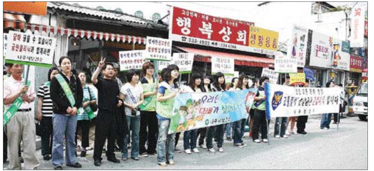
“금연은 선택 아닌 필수입니다” 나주시 보건소가 ‘제 21회 세계 금연의 날’을 맞아 지난달 29일 나주터미널 및 중앙동 일원에서 100여명의 시민, 학생 등이 참여한 가운데 대대적인 금연 캠페인을 벌였다. 나주시는 세계보건기구(WHO)가 매년 5월 31일을 ‘세계 금연의 날’로 지정함에 따라 각종 행사 개최시 금연 캠페인을 전개하고 금연 콜센터(1544-9030)와 전문 상담인이 상주하는 금연클리닉(061-333-9263)을 개설했다.