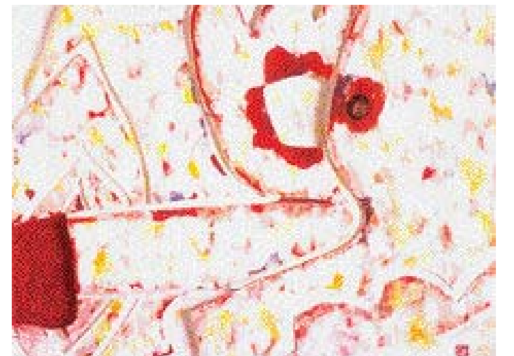
윤애근 작 'space-花心'

한국화 대가들의 맑고 잔잔한 화풍을 한자리에서 감상할 수 있는 전시회가 광주에서 열린다.