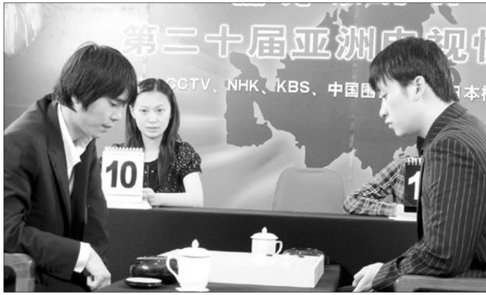
“역시 쉼돌” 이세돌 TV바둑페스티벌 우승 이세돌 9단(왼쪽)이 지난 4일 중국 베이징에서 열린 제20회 TV 바둑아시아선수권대회 결승전에서 조한승 9단을 꺾고 우승을 차지했다.

을 8위로 밀어내며 6위에 올랐다. /오광록기자 kroh@kwangju.co.kr