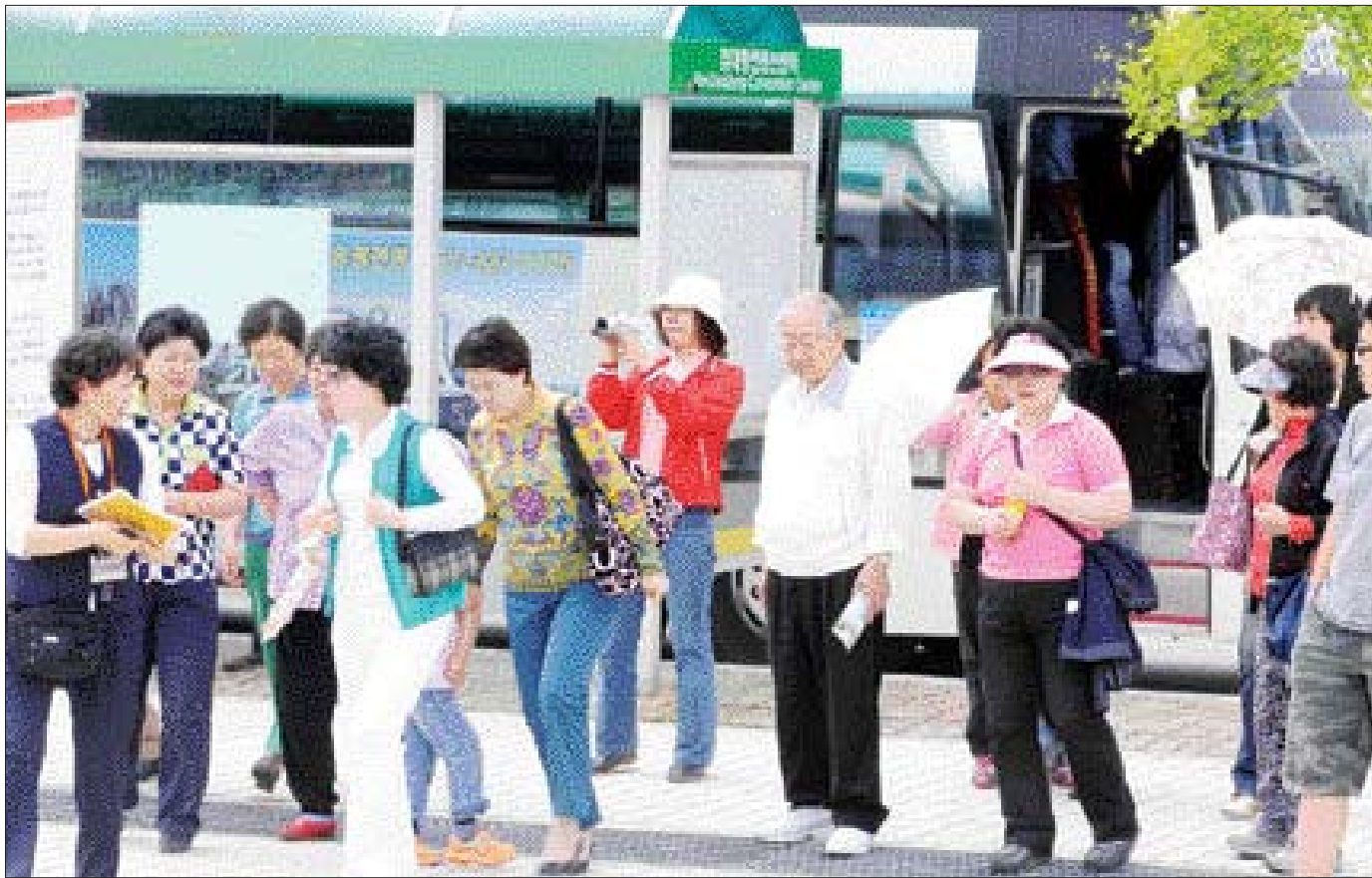
주말인 지난 7일 광주 시티투어버스를 타고 상무지구 5·18자유공원을 찾는 관광객들이 가이드의 설명을 듣고 있다.

시는 시티투어버스에 관광가이드를 배치, 관광객에 대해 상세한 안내를 하도록 했다. 버스 이용료는 무료며 탑승객들은 점심값만 부담하면 된다. 식당은 광주의 맛살스런 음식들을 선보이는 곳으로 안내할 계획이다. 입장료가 있는 관광지인 경우 관광객이 개별적으로 선택해 이용할 수 있다. 투어를 원하는 시민이나 관광객들은 탑승 하루 전 오전 9시부터 오후 5시까지 사전 예약하고 버스 출발지나 경유지에서 시간에 맞춰 탑승하면 된다. 탑승 예약은 광주시 종합관광안내소(062-233-3399)나 송정역 안내소(062-941-6301)로 하면 된다. 시는 이와 함께 광주·전남 관광의 공동 활성화를 위해 기존에 운행중인 광주 인근 시·군 관광버스와 전남도 순환버스를 이용할 수 있도록 탑승장소를 코스에 반영했다.