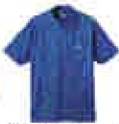
북페이스 아웃도어 [제품명] [가격]