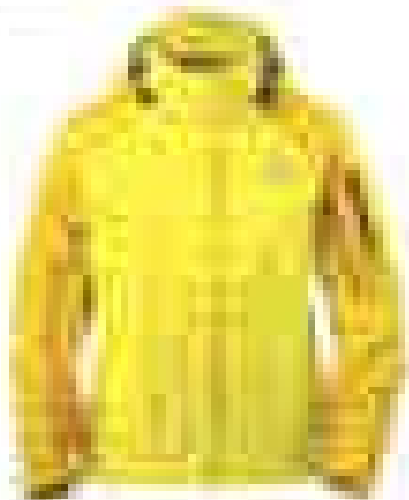
북페이스 아웃도어 [제품명] [가격]