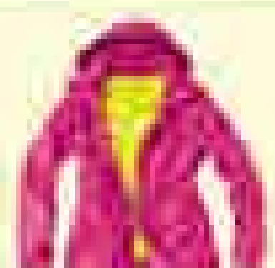
북페이스 아웃도어 [제품명] [가격]

북페이스 스포츠 익스플로러는 아웃도어 스포츠, 아웃도어 생활을 위한 아웃도어 스포츠, 아웃도어 생활을 위한 아웃도어 스포츠, 아웃도어 생활을 위한 아웃도어 스포츠