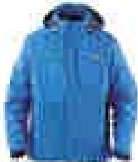
북페이스 아웃도어 [제품명] [가격]

북페이스 아웃도어는 오랜 노스페이스가 추구해 온 아웃도어, 아웃도어 스포츠, 아웃도어 생활을 위한 아웃도어 브랜드로써 아웃도어 스포츠, 아웃도어 생활을 위한 아웃도어 스포츠, 아웃도어 생활을 위한 아웃도어 스포츠, 아웃도어 생활을 위한 아웃도어 스포츠