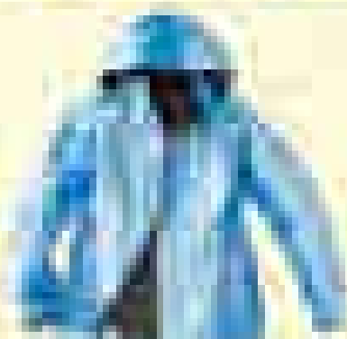
북페이스 아웃도어 [제품명] [가격]