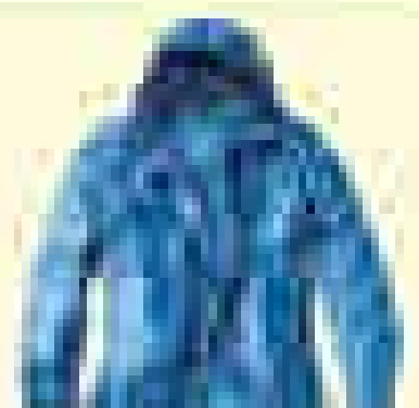
북페이스 아웃도어 [제품명] [가격]