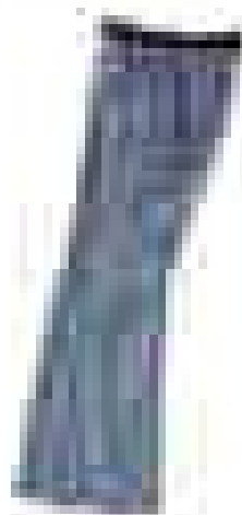
북페이스 아웃도어 [제품명] [가격]