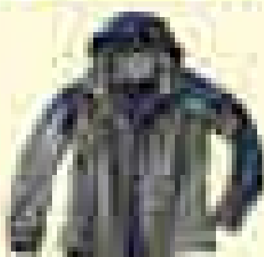
북페이스 아웃도어 [제품명] [가격]