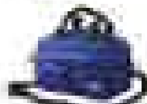
북페이스 아웃도어 [제품명] [가격]