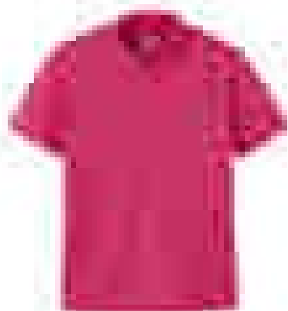
북페이스 아웃도어 [제품명] [가격]