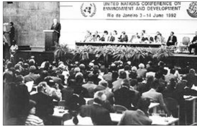
지난 1992년 6월 브라질 리우데자네이루에서 열린 지구정상회담

의제 21은 지구환경보전과 지속가능한 개발을 위한 행동계획을 담고 있다. 의제 21은 지속가능한 성장을 위한 사회·경제적 과제, 자원의 보존과 관리, 주요 단체들의 역할 강화, 집행을 위한 수단 등 크게 다섯 부분 총 40장으로 이루어져 있다. 지구환경보전을 위한 지방정부 역할